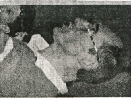
Jean-Jacques Beltramo : « Nous devons former des dirigeants compétents ».

— Quelles activités sportives particulières offrez-vous ?