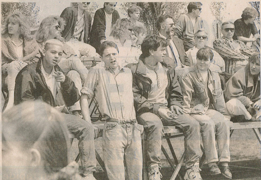
Cette grande fête a attiré plusieurs milliers de spectateurs.