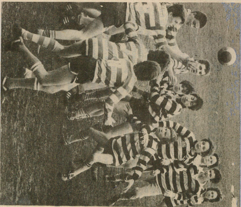
Une phase de jeu particulièrement disputée entre Villers et Saint-Dié.

Classement général du challenge Fernand-Vié : 1. Colmar, 5 points ; 2. Dieulouard, 12 points ; 3. Verdun, 14 points ; 4. Kronenbourg, 15 points ; 5. Entente PTT, Vandoeuve, 18 points ; 6. Exaquo Yutz et RC Metz, 20 points ; 8. Longwy, 21 points ; 9. Golbey, 26 points ; 10. Exaquo SLUC et Hayange, 29 points ; 12. Exaquo Entente Einville-Lunéville et Villers, 33 points ; 14. Colmar (2), 38 points ; 15. Pont-à-Mousson, 44 points.