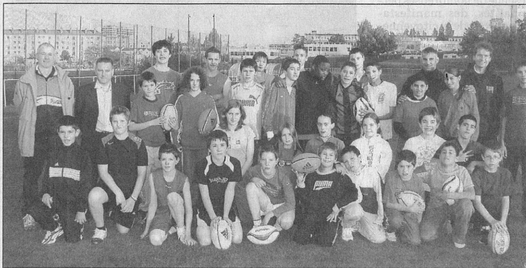
Le rugby a du succès.

Le collège Jacques-Callot n'a pas attendu le grand boom suscité par la Coupe du Monde de rugby pour s'intéresser à ce sport.