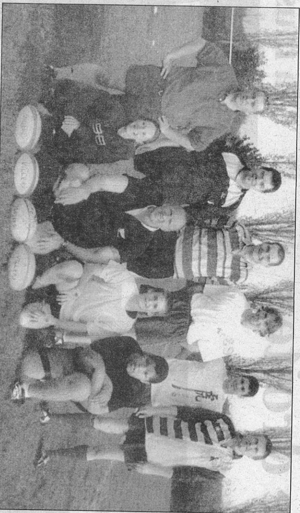
Un premier entraînement qui a réuni une dizaine de joueurs.

En effet, les obligations familiales ou professionnelles empêchent certains joueurs de pratiquer le rugby parce qu'ils ne peuvent être disponibles régulièrement pour intégrer une équipe