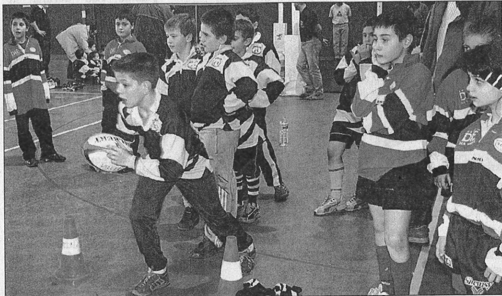
Une animation qui a réuni plus de soixante jeunes.

A savoir : le rugby-flag, l'évitement et l'intelligence stratégique avec le jeu « Poules, renard et vipères », le travail sur l'affectif et le combat collectif avec « Le jeu rugby-judo », l'atelier de coopération et l'entraide dans un combat loyal avec « Le jeu de la forteresse », l'initiation à la sécurité par un parcours de dos « Relais dessus-des-